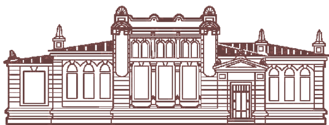
Уфимский федеральный исследовательский центр Российской Академии наук