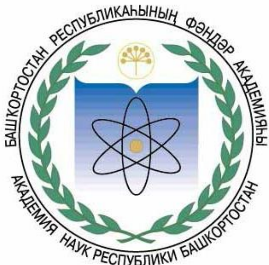
Академия наук республики Башкортостан