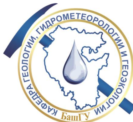
Кафедра геологии, гидрометеорологии и геоэкологии Факультета наук о Земле и туризма Башкирского государственного университета