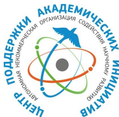
Автономная некоммерческая организация содействия научному развитию "Центр поддержки академических инициатив"