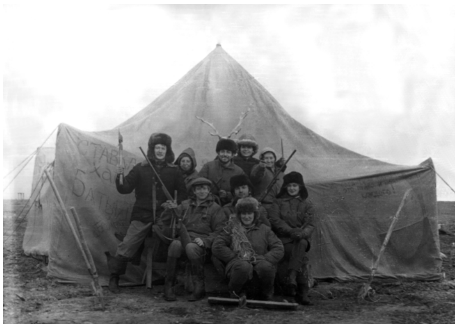
Рис. 4. Ямальская экспедиция. Август, 1978 г.

Дежурство на кухне превращалось в «черный день», так как сырые дрова проходило растапливать соляркой. На печке-буржуйке все блюда получались очень вкусными. Иногда мы пекли лепешки, считавшиеся деликатесом, свежего хлеба не было, а сухари быстро надоели. Меню старались разнообразить, а блюдам придумать северные названия. Например, на завтрак почти всегда была верми-