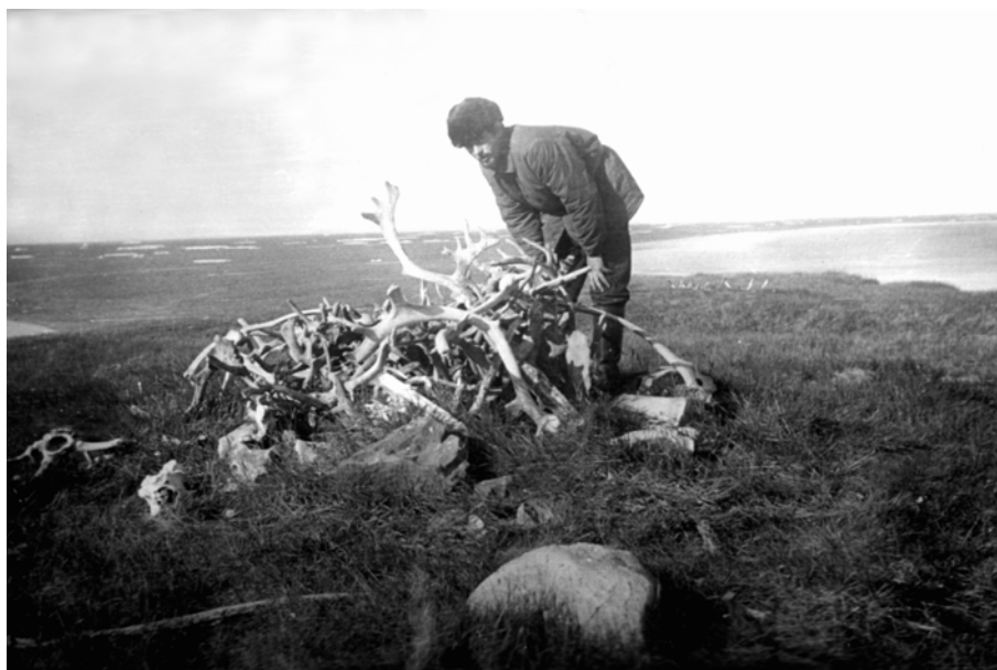
Рис. 3. И.Н. Семенов. Священное место ненцев, устье р. Тиутей-Яха. Август, 1978 г.

как будто понимают, что прожить и выжить в суровых условиях можно только в дружбе.