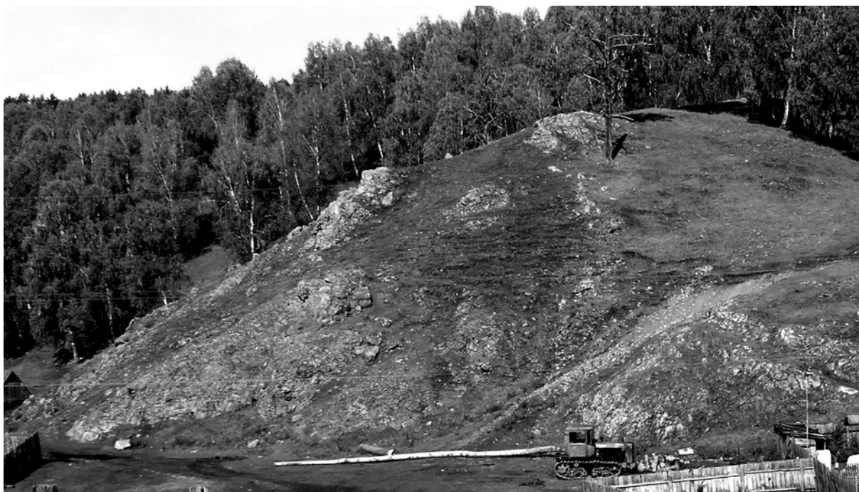
Рис. 2. Олистостром на юго-западной окраине д. Магадеево

Непосредственный контакт серпентинитов краевой зоны массива Южный Крака с терригенными породами зилаирской свиты можно наблюдать на тракте Кага – Старосубхангулово, западнее д. Яумбаево (рис. 3). Этот контакт посещался многими специалистами, потому на его характер существуют разные точки зрения. Долгое время не сомневались, что он является результатом активного внедрения гипербазитовой магмы в осадочные образования. Затем считали, что здесь наглядно нормальное стратиграфическое налегание отложений палеозоя [7] либо докембрия [6] на серпентинизированные гипербазиты. Наши исследования показали, то этот контакт следует рассматривать как тектонический [2].